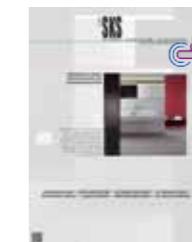
Zum PDF der vollständigen Ausgabe 3.2018

Mehr Informationen und Bilder über das Restaurant und die lukullischen Besonderheiten: https://www.tunatecabalfego.com/ . Über das Unternehmen Balfegó mit Informationen über den roten Thunfisch: https://balfego.com/en/ (englisch). Informationen über den Hersteller der keramischen Fliesen in dem Restaurant über Tile of Spain: www.tileofspain.de oder die Spanische Wirtschafts- und Handelsabteilung Düsseldorf: dportales@comercio.mineco.es