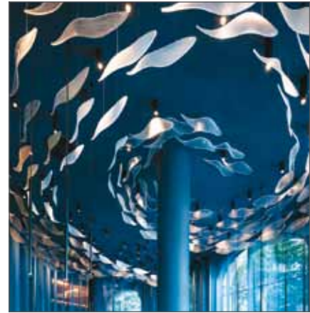
La Tunateca Balfegó: