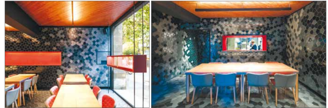
Die trapezartige Form und verschiedene Blau-Grau-Töne der keramischen Fliesen zaubern eine geheimnisvolle Atmosphäre. Einige große, dunkelrote Kissen und die Stuhllehnen dienen als Kontrapunkt und schaffen eine Verbindung zur Küche sowie zu weiteren Räumen. Auch der rötliche Holzfarbton der Decke hilft, einen warmen Kontrast zu den keramischen „Schuppen“ zu schaffen.